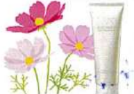
コスメデコルテ クレンジングクリーム 150ml 4,850円(税込)