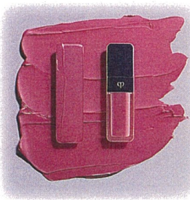
クレド・ポーボーテ ルージュクレームブリアン 全8色 各5,500円(税込)