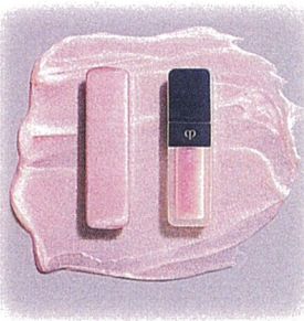
クレド・ポーボーテ ルージュクレームエタンスラン 全4色 各5,500円(税込)